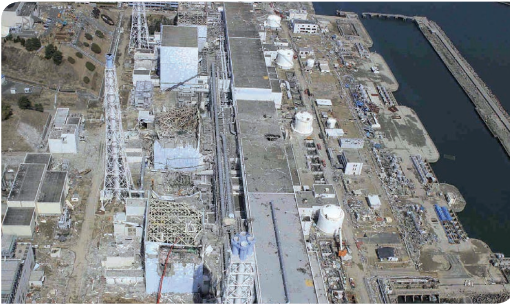
Kernkraftwerksstandort Fukushima Daiichi an der Ostküste Japans in der Präfektur Fukushima, ca. 250 km nördlich von Tokio vor dem 11. März 2011 (links) und nach dem verheerenden Tsunami und den nachfolgenden Wasserstoffexplosionen (rechts)

Dort befinden sich sechs Siedewasserreaktoren mit einer elektrischen Nettoleistung von insgesamt 4.547 Megawatt, die zwischen 1971 und 1979 in Betrieb genommen wurden und zur ältesten Generation der in Japan gebauten und betriebenen Kernkraftwerke gehören.